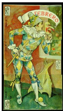
Apel·les Mestre, «Febrero» (tres cromos de Chocolate Amatller para la serie «Los meses»), 1906. Cromolitografía sobre cartulina, 9 x 14 cm (cada uno). Biblioteca de Catalunya, Barcelona

En la Barcelona de 1900, las artes gráficas viven un momento de gran prosperidad, y el cromo es una pieza importante. Casi todos están relacionados con productos comerciales, pero los más conocidos son los del chocolate y las cajas de cerillas. Los cromos se coleccionan en álbumes temáticos de páginas que a menudo se hallan estampadas con dibujos, sobre los cuales se pegan los pequeños impresos. Esta relación entre imagen dibujada e imagen fotográfica reproducida mecánicamente recuerda bastante la que Picasso establece en su dibujo.