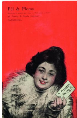
Ramon Casas, Postal publicitaria de Pèl & Ploma, 1900-1905. Litografía sobre cartulina 14 x 10 cm. Biblioteca de Catalunya, Barcelona.

yecto de cartel, y en varias revistas populares francesas, como el semanario Frou-frou , que le publica cuatro dibujos entre 1901 y 1903.