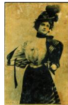
Cavelle (cromo de caja de cerillas). Fototipias sobre papel barnizado, 5,5 x 3,6 cm. c. 1900. MAE. Institut del Teatre, Barcelona