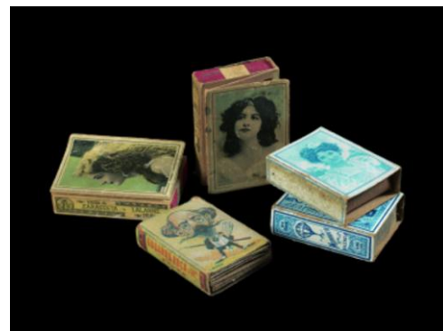
Cajas de cerillas con cromos de artistas y caricaturas de personajes de la época, c.1900, 6 x 4 x 1,3 i 5 x 3,7 1,5 cm. Museu Frederic Marès, Barcelona