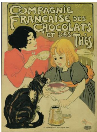
Theophile-Alexandre Steinler, cartel publicitario de la Compagnie Française des Chocolats et des Thés. Litografía, 80 x 60 cm. Museum für Gestaltung Zürich Plakatsammlung Franz Xaver Jaggy © ZHdK

Poco después de dibujar Hombre apoyado en una pared , Picasso entra en contacto con el activo mundo de las artes gráficas de Barcelona. La necesidad de ganar dinero le lleva a participar en concursos de carteles, a realizar tarjetas comerciales o a diseñar menús. Un dibujo de la época, donde el pintor escribe repetidamente “Fábrica de dibujos Pablo Ruiz Picasso Barcelona”, con un tipo de letra que recuerda un anuncio, refuerza esta idea. Hacia 1899, el joven Picasso muestra un gran interés por el “artista de quiosco” Théophile-Alexandre Steinlen; escribe reiteradamente el nombre en una hoja y lo cita de forma indirecta en un retrato de su padre con el Gil Blas Illustré , una de las publicaciones donde colaboraba Steinlen.