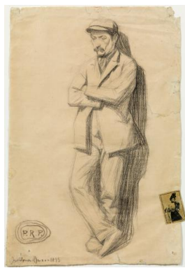
PABLO PICASSO, Hombre apoyado en una pared . Barcelona, marzo del 1899. Lápiz Conté sobre papel e ilustración pegada en el margen. 49 x 32,7 cm. Museu Picasso, Barcelona. © Sucesión Pablo Picasso, VEGAP, Madrid 2012

El dibujo Hombre apoyado en una pared forma parte de una serie de estudios del natural que Picasso realizó en el Círculo Artístico de Barcelona entre febrero y marzo de 1899, un momento crucial en el que el joven artista decide, en contra de la voluntad de su padre, abandonar los estudios académicos e iniciar la carrera de pintor independiente. La pequeña pieza encolada en la parte inferior derecha es un cromo de caja de cerillas de una serie dedicada a artistas del espectáculo, un tipo de imagen muy popular en la época. La figura fotografiada es la actriz francesa Angeline Cavelle.