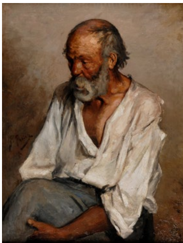
Pablo Picasso El viejo pescador

Málaga, 1895 Óleo sobre lienzo 83 x 62,5 cm.