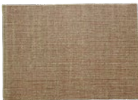
Álbum de Barcelona, 1897 Barcelona, 1897

8,6 x 12,3 x 0,5 cm 13 x 10 x 3,5 cm Museu Picasso, Barcelona