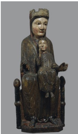
Anónimo Virgen de Gósol

Segunda mitad del siglo XII Talla en madera policromada y restos de hoja metálica corlada 85,5 x 39,5 x 32 cm