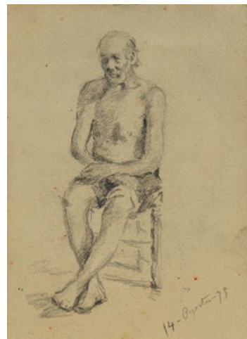
Pablo Picasso Estudio para Viejo pescador Álbum de Madrid, Málaga y Barcelona, 1895-1896