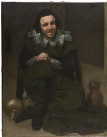
Diego Velázquez El bufón Calabacillas