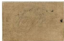
Álbum de Madrid, 1898 Madrid, 1898

11 x 18 x 1 cm 18,5 x 12,5 x 2 cm Museu Picasso, Barcelona