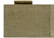
Álbum de A Coruña, Málaga y Barcelona, 1895-1896 Barcelona, 1895-1896

8,3 x 12,8 x 1,2 cm 14 x 11 x 2,5 cm Museu Picasso, Barcelona