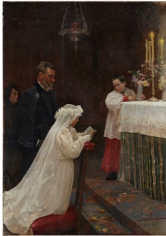
Pablo Picasso Primera Comunion

Barcelona, enero-marzo de 1896 Óleo sobre tela 165 x 117 cm