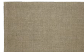
Álbum de Barcelona, 1899 Barcelona, c. 1899

12,1 x 20 x 1 cm 13,4 x 21,2 x 2 cm Museu Picasso, Barcelona