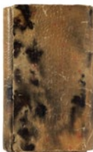
Carnet català Gósol, mayo-agosto de 1906

12,5 x 8 cm 13,5 x 8,5 x 2 cm Museu Picasso, Barcelona