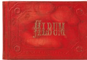
Álbum de A Coruña, 1894-1895 A Coruña, 1894-1895

13,5 x 20 x 1 cm 14,5 x 20,5 x 2 cm Museu Picasso, Barcelona