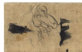
Álbum de Madrid, 1898 Madrid, 1898

12,5 x 20 x 0,7 cm 13,5 x 20,5 x 2 cm Museu Picasso, Barcelona