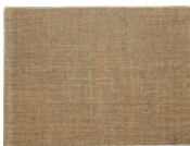
Álbum de Barcelona, 1896 Barcelona, 1896

8,4 x 11,5 x 2 cm 13,5 x 11 x 2 cm Museu Picasso, Barcelona