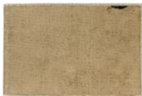
Álbum de Madrid, 1898 Madrid, 1898

9,3 x 13,9 x 1 cm 11 x 14,5 x 2 cm Museu Picasso, Barcelona