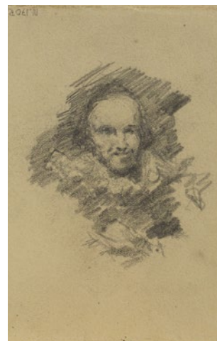
Pablo Picasso Copia de El bufón "Calabacillas" de Velázquez Álbum de Madrid, Málaga y Barcelona, 1895-1896

Madrid, 16 de abril del 1895 Lápiz grafito sobre papel 12,2 x 8,1 cm