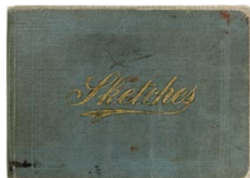
Álbum de Barcelona y Málaga, 1896, Barcelona, Málaga, 1896

13 x 18,5 x 0,7 cm 13,5 x 20 x 2 cm Museu Picasso, Barcelona