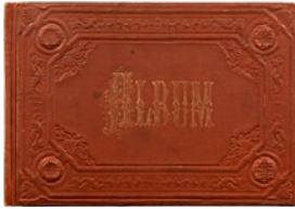
Álbum A Coruña, 1894 A Coruña, 1894

13,5 x 19,5 x 1,2 cm 14,5 x 21,5 x 3 cm Museu Picasso, Barcelona