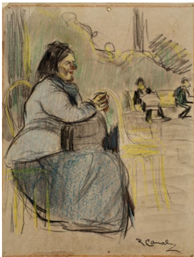
Ricard Canals Mujer sentada en un banco

c. 1896-1900 Pastel, tinta al pincel, lápiz Conté y lápiz de grafito sobre papel 30,9 x 23,7 cm