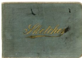
Álbum de Barcelona, 1896 Barcelona, 1896

13 x 18,6 x 1 cm 20 x 14,5 x 2,5 cm Museu Picasso, Barcelona