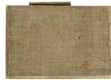
Álbum de Madrid, Málaga y Barcelona, 1895-1896 Madrid, Málaga, Barcelona, 1895-1896

8,5 x 13 x 1 cm 9 x 13,5 x 2 cm Museu Picasso, Barcelona