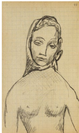
Pablo Picasso Fernande con pañuelo Carnet catalán

Museu Nacional d'Art de Catalunya, Barcelona. Adquisición, 1930