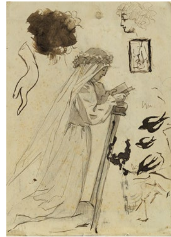
Pablo Picasso Estudio para Primera Comunion y otros croquis Álbum de Barcelona, 1896

Museu Picasso, Barcelona Donación Pablo Picasso, 1970