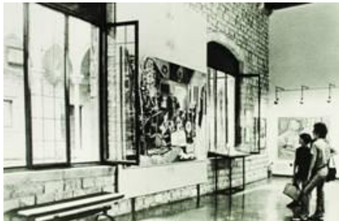
Part de la sèrie de Las Meninas instal·lada al palau Berenguer d'Aguilar, novembre del 1971. Museu Picasso, Barcelona

La col·lecció es vertebrava a l'entorn de dos eixos principals: d'una banda, les obres de formació i joventut de Picasso, i, per l'altra, la sèrie Las Meninas , de 1957. Aquestes dues característiques doten el museu d'una especial singularitat, perquè permet estudiar l'obra de formació de l'artista de manera incomparable i perquè acull l'única sèrie completa d'interpretacions d'obres d'altres artistes realitzada per Picasso a les dècades de 1950 i 1960.