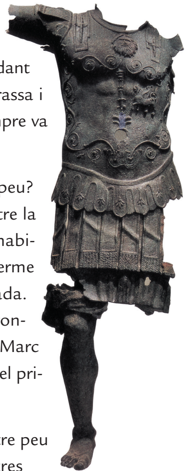
Estàtua de bronze. Museu de Cadis.