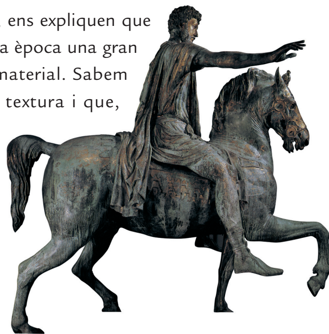
Marc Aureli a cavall. S. II dC. Museus Capitolins. Roma.

Si comprovem les mesures, 14 cm d'ample per 27 cm de llarg i tenim en compte que li manquen una bona part dels dits, podem suposar que formava part d'una estàtua de