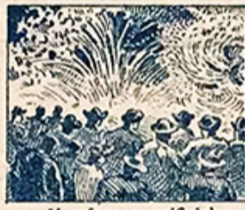
20.—Hay fuegos artificiales, la noche del veinticinco, muy bellos y originales.