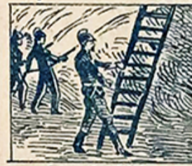
29.—La revista de bomberos es, el día veintiocho, de los festejos primeros.