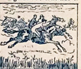
37.—De Octubre, el día primero, la fiesta hípica, en el Parque presenciara el pueblo entero.