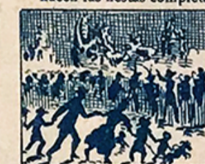
36.—Y hasta de tanta regata, contemplará, por la noche, la Artística Cabalgata.