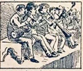
25.—Las coplas y las orquestas del Ampurdán prestan lustre el veintisiete; á las fiestas.