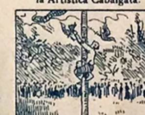
42.—Y á gentes propias y extrañas, en los jardines del Parque divertirán las cucañas.