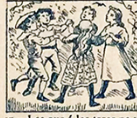
17.—Los que á los toros no van, con los niños en el Parque, también se divertirán.