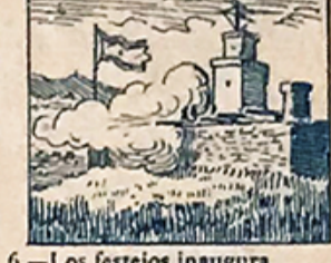
6.—Los festejos inaugura el castillo de Montjuich d6 el cañ6n trueno y fulgura