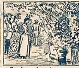
22.—Por la tarde se inaugura un gran concurso de premios para la floricultura.