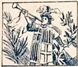
1.—Lectores mirad y ved lo que son, en Barcelona las fiestas de la Merced.