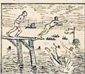
33.—Ganarán los nadadores tres cerdos y doce patos y hasta baños superiores