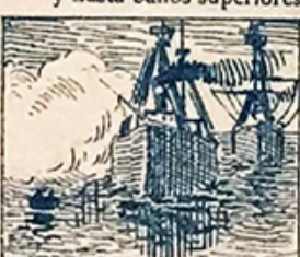
39.—Tendrá la parte naval, con la gran fiesta marítima atractivo colosal.