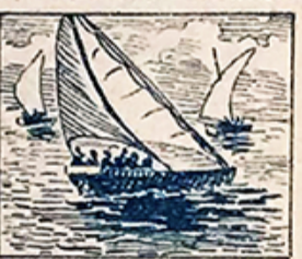
31.—En el día veintinueve las Regatas del Real Club agrardarán... si no llueve.