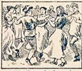
26.—Por la tarde, la sardana y otros bailes populares dan aumento á la jarana.