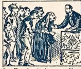
8.—Es, el veinticuatro, día en que el reparto de bonos da á los pobres alegría.