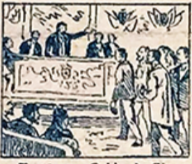
19.—En el gran Salón de Ciento, los premios á la virtud dejan al pueblo contento.