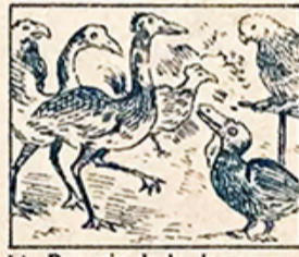
14.—Pero sin duda, lectores, son las jaulas de los pájaros, entre todas, las mejores.