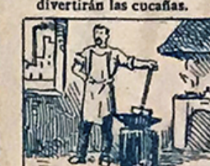
48.—Y trás gozar á destajo, el honrado catalán reanuda su trabajo.

De venta en la calle de Tallers, núm. 61, tienda