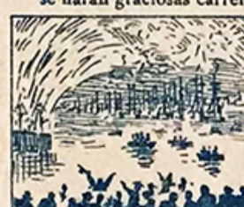
40.—Y por la noche, habrá luego varios castillos de pólvora porque, trás el agua, el fuego.