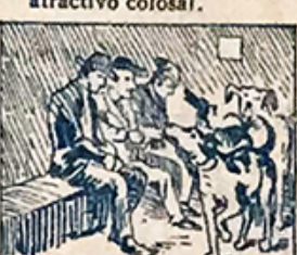
45.—Hay quien viene aquí en primera y, cuando á su pueblo vuelva tiene que hacerlo en perrera.