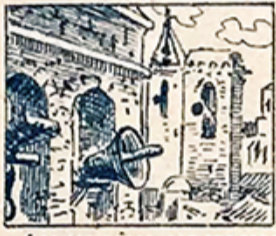
7.—Las campanas, con sus sonos, también, al público anuncian que comienzan las funciones.