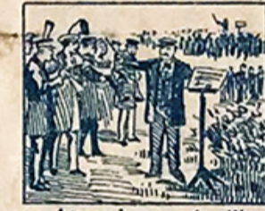
24.—Atraen la gente á millares, la banda Municipal y las bandas militares.