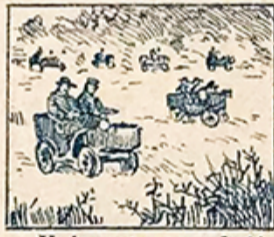
27.—Va la gente, en confusión al concurso de automóviles, que es moderna diversión.