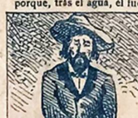
46.—Y abundan aquí burgueses que se quedan empedados para diez ó doce meses.