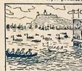
35.—También el treinta hacia el mar va la gente á las regatas ansiosa de disfrutar.