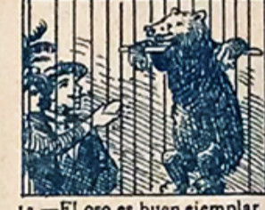
12.—El oso es buen ejemplar en el que, no pocos novios, se debían de mirar.