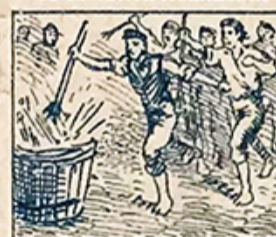
34.—Para gentes bullangueras, de cubos y de barricas se harán graciosas carreras.