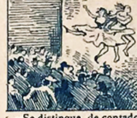
5.—Se distingue, de contado, la Piza del Buen Suceso por su Dioramo animado.