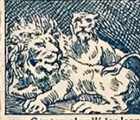
10.—Contempla allí los leones cuya soberbia actitud encoge los corazones.