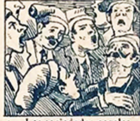
3.—Las sociedades corales, el 23 de Septiembre dan notables festivales.