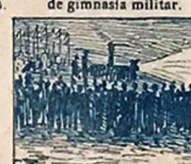
47.—La retreta militar anuncia el fin de las fiestas, pues todo se ha de acabar.