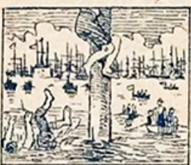
32.—La marítima cucaña parece diversión fácil, pero á mucha gente engaña.