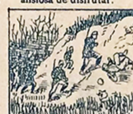
41.—Podrá la gente admirar, el día dos, el Concurso de gimnasia militar.