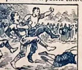
43.—El concurso regional de Foot-Ball será, sin duda, diversión original.