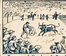
16.—Por ver al Bomba, al Bombita, á Reverte y al Conejo, la gente se despepita.