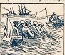
38.—Festejo de lucimiento será el de las sociedades llamadas de salvamento.