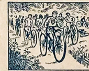
30.—Concurso de bicicletas y otros juegos muy variados hacen las fiestas completas.