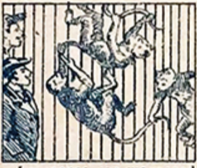
13.—Los monos, con sus monadas á los chicos y á los grandes arrancan mil carcajadas.