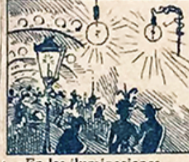
4.—En las iluminaciones compiten gas, luz eléctrica y faroles y blandones.