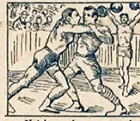
23.—Y á los más preocupados, la fiesta atlética prueba que no estamos extenuados.