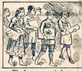
21.—El 26 son premiados los que en las municipales escuelas son aplicados.