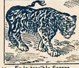
11.—Es la terrible fiera del tigre que esta enjaulado, aún mayor que su belleza.