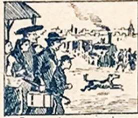
2.—Por caminos y estaciones llega gente á la ciudad en confusos pelotones.