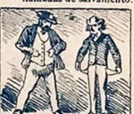
44.—A pesar de su gran brillo, los festejos oscurecen á mucha gente el bolsillo.