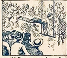
9.—Al Parque, por la mañana al concurso de gimnasia va la gente de jarana.