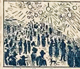
28.—Es la calle de Fernando de las que más se distinguen su extensión iluminando