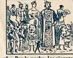
18.—Por la noche, los gigantes, enanos y cabezudos, lucen trajes elegantes.