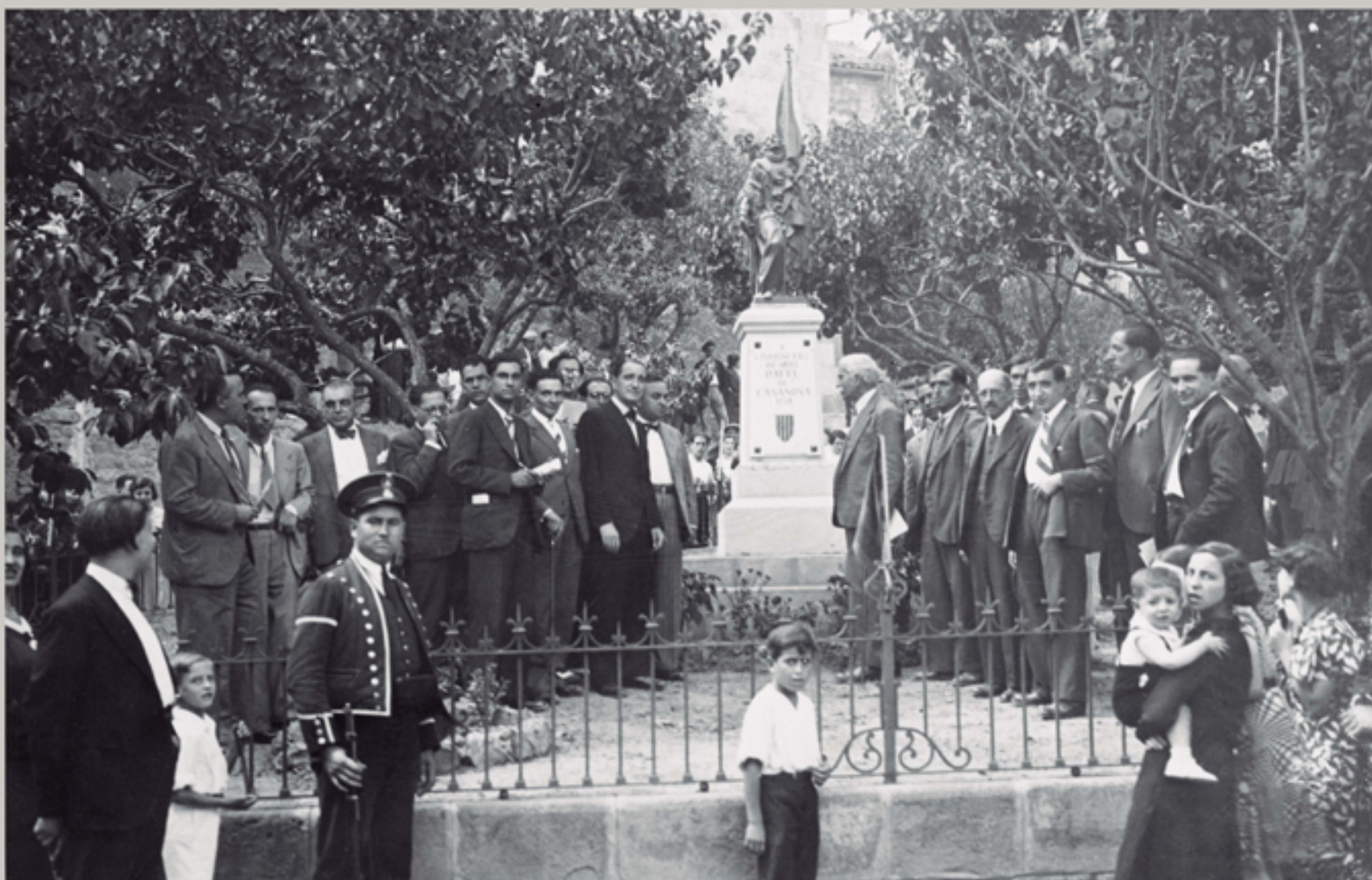
Escultura de Rafael Casanova del Museu de Sant Boi de Llobregat, exemplar policromat adquirit a un particular l'any 2001.