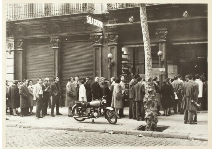
Exposició Picasso a la Sala Gaspar, 1960

L'abril del 1904 Picasso se'n va definitivament a París, però manté el lligam amb Barcelona fent-hi estades per visitar els amics i per veure la família, que va seguir vivint a Barcelona, fent donació d'obres a la ciutat i presentant dues exposicions monogràfiques en l'organització de les quals també participa.