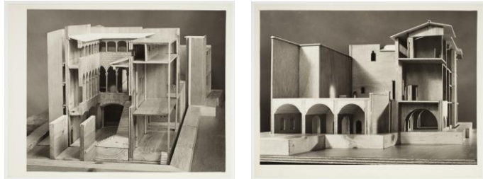
Maqueta del Palau Berenguer d'Aguilar, s/d, Autor desconegut