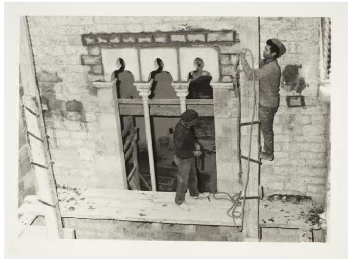
Obres de rehabilitació del Palau Baró de Castellet, 28/10/1970, Museu Picasso, Barcelona.

A la fotografia es mostren les obres de rehabilitació del palau Baró de Castellet.