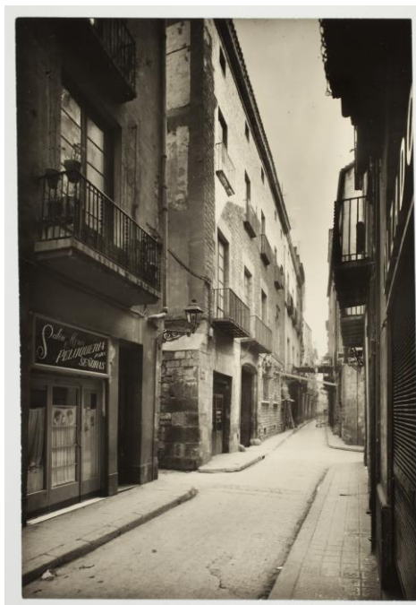
Carrer Montcada, 26/01/1957, Fons Jaume Sabartés, Museu Picasso, Barcelona. Fotografia: desconegut

El naixement del carrer Montcada, al segle XII, va donar lloc a l'aparició progressiva del barri de la Ribera, un dels nuclis urbans de major importància històrica i patrimonial de la ciutat de Barcelona. La zona va anar creixent fins a arribar a tenir una gran esplendor, però cap al 1900 va començar a entrar en franca decadència. Als anys trenta un grup de personalitats es van aplegar sota el nom d'Amics del Carrer de Montcada amb la intenció d'esperonar l'Ajuntament de Barcelona a recuperar el barri. El consistori va estar molt receptiu i va restaurar unes quantes façanes, i el 1953 va comprar el palau Berenguer d'Aguilar per rehabilitar-lo i dedicar-lo a activitats d'interès públic. El 1960, Sabartés, a proposta de l'Ajuntament, va triar aquest palau per instal·lar-hi el Museu Picasso, ja que es trobava al bell mig de la Ribera, el barri que evoca la Barcelona de Picasso i on l'artista va viure entre el 1895 i el 1904.