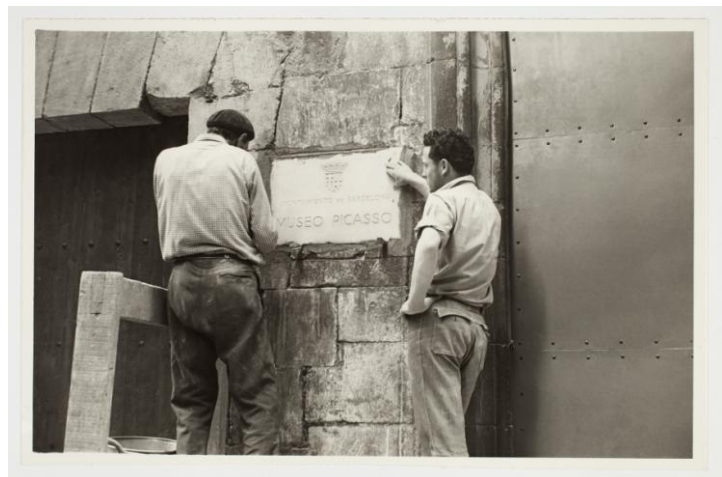
Col·locació de la placa del Museu Picasso, 1963.

A banda d'aquestes tres mostres que s'aniran succeint durant tot l'any, s'ha organitzat un seguit d'activitats entre les quals destaca la jornada de portes obertes que se celebrarà el proper dissabte –data de la inauguració– i que comptarà amb la participació dels membres de l'equip del Museu, que oferiran als visitants una visió seva particular de la seves obres preferides de la col·lecció. Seran doncs els barcelonins, els visitants, els que inauguraran El Museu Picasso, 50 anys a Barcelona. Els orígens , la primera de les mostres organitzades per a l'ocasió.