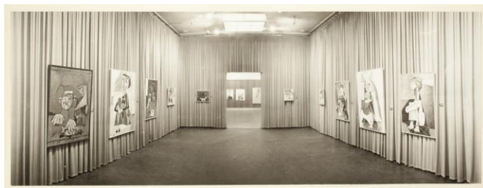
Exposició Picasso a la Sala Gaspar, 1960