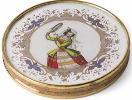
Capsa, mitjans del segle XIX