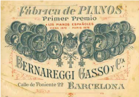
Etiqueta comercial de la fàbrica de pianos Bernareggi Gassó y C a , segona meitat del segle XIX