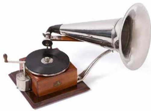
Gramòfon, primer quart del segle XX