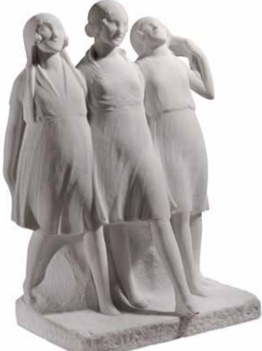
Tres joves, Frederic Marès, 1915-1922