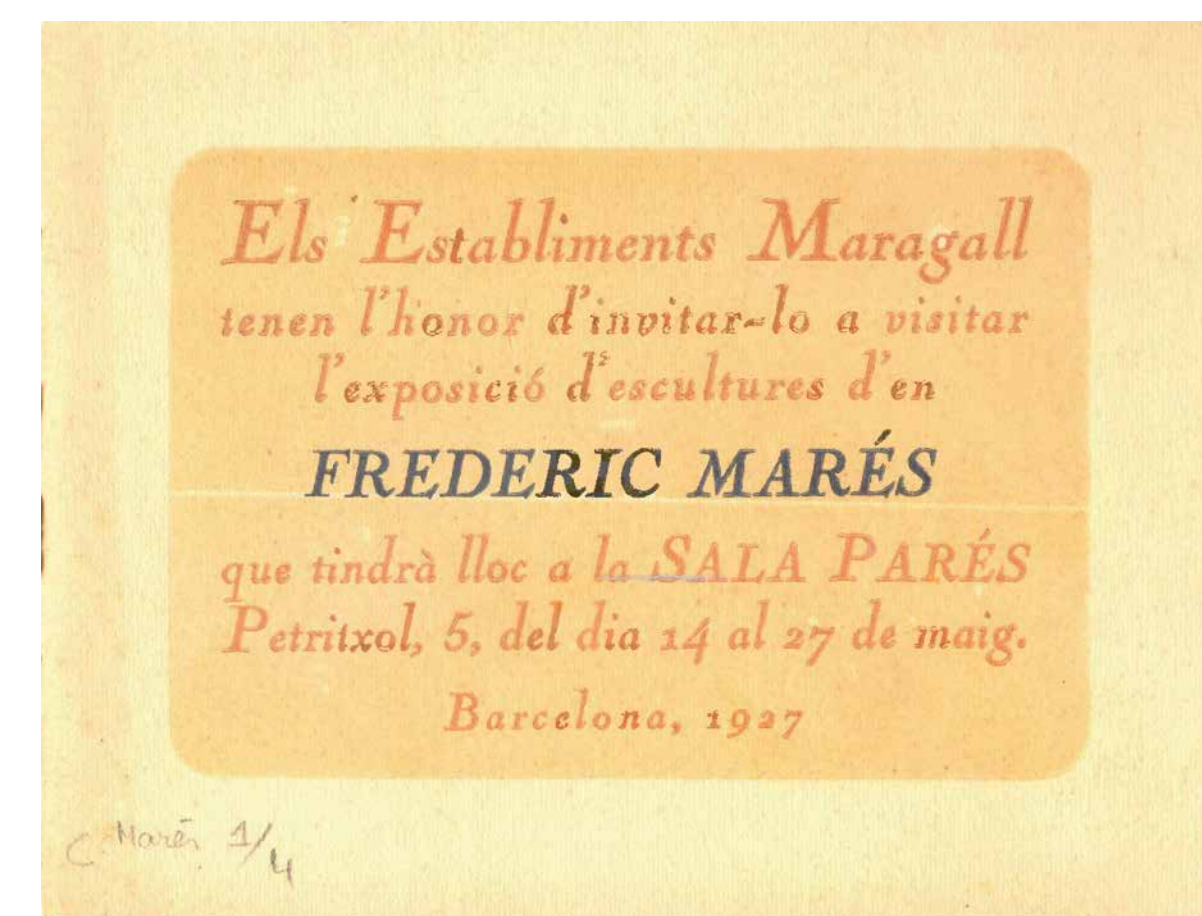
Catàleg de la Sala Parés de Barcelona, 1927