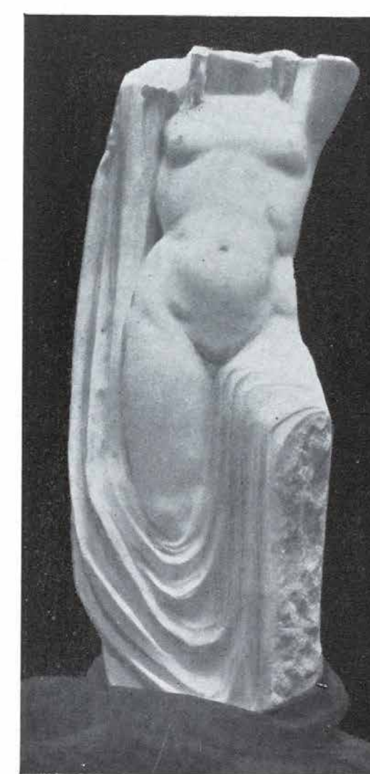
MARÉS, FREDERIC Marbre