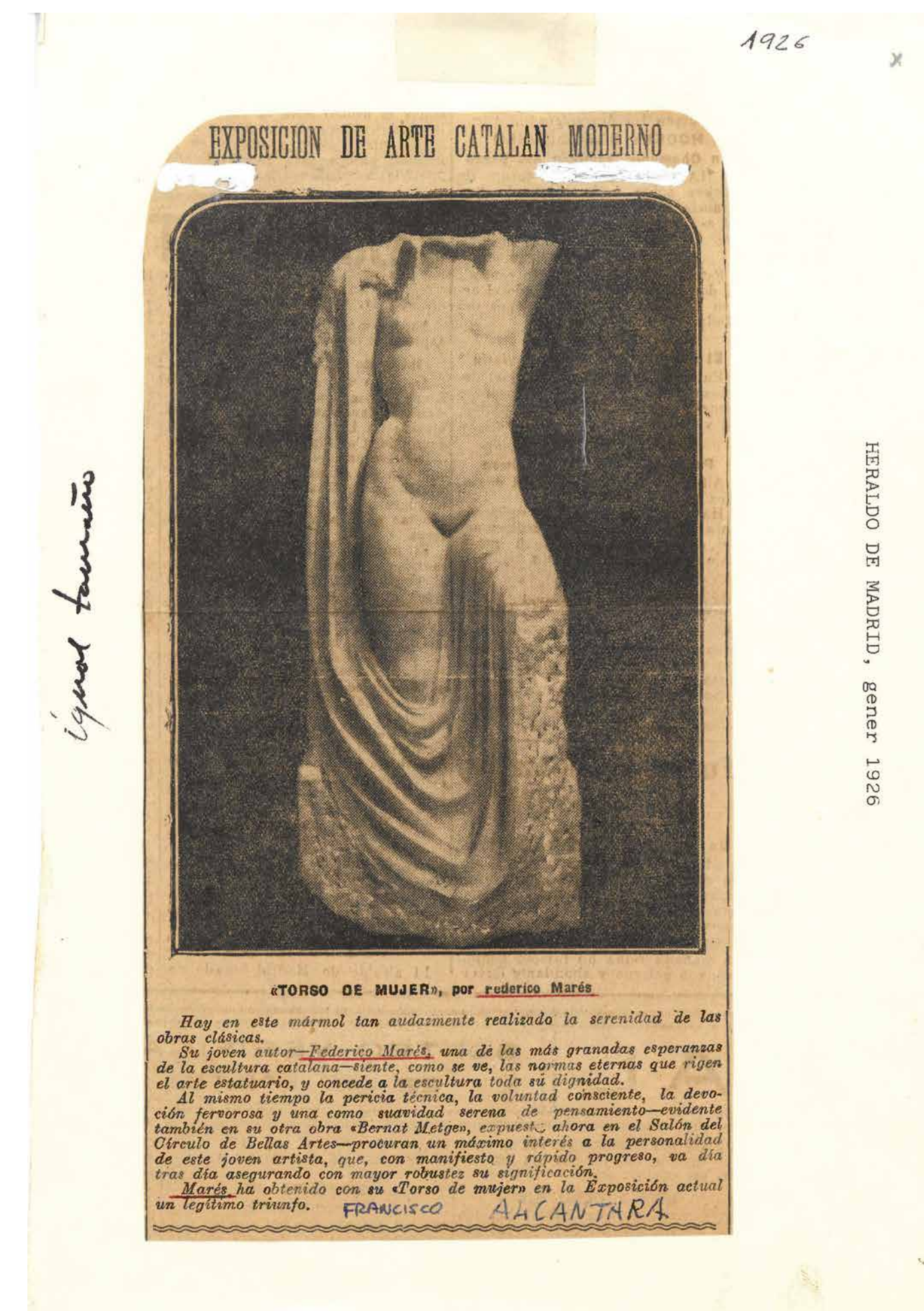
El Heraldo de Madrid, 21 de gener de 1926