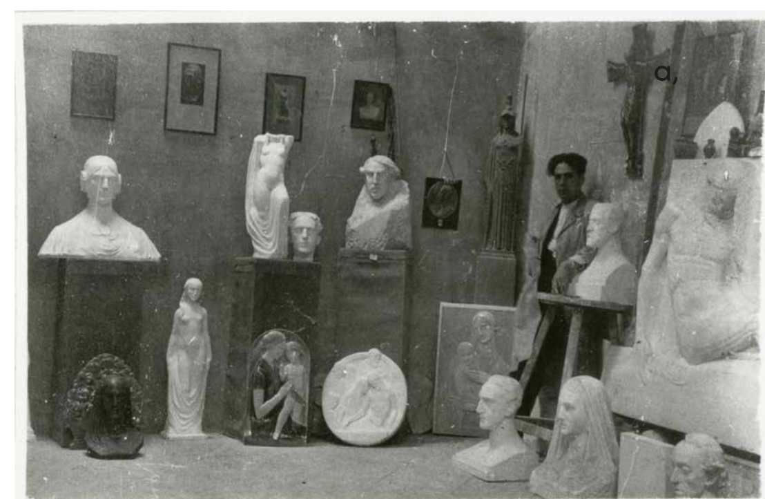
Taller de Frederic Marès al carrer Mallorca de Barcelona, 1922-1925. Al centre, Tors de dona.