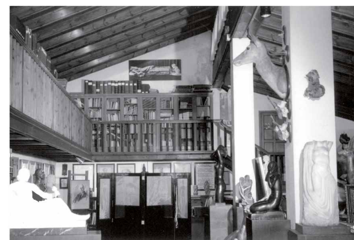
Estudi-biblioteca de Frederic Marès, entre 1998 i 1999. A la dreta, en primer terme, Tors de dona .