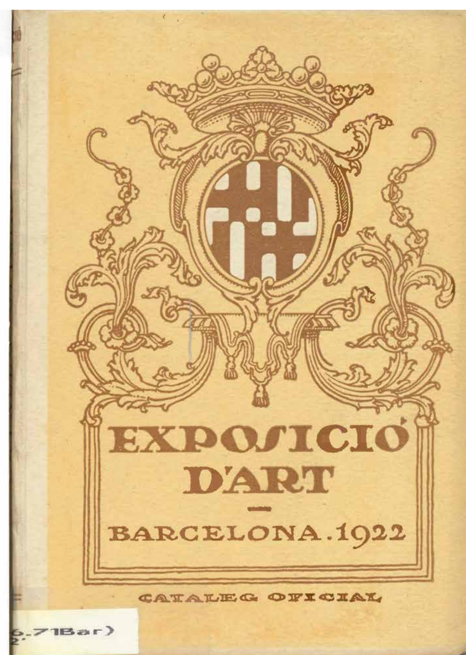
Portada del catàleg de l'Exposició d'Art de Barcelona i fotografia interior de Tors de dona o Marbre , Barcelona, 1922